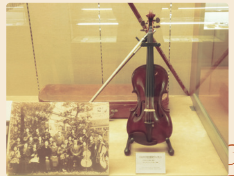
数奇な運命を辿った被爆バイオリン

開館日：火曜日～金曜日 開館時間：10:00～16:00 休館日：月曜日、土曜日、日曜日、祝日 お問い合わせ：082-225-6335