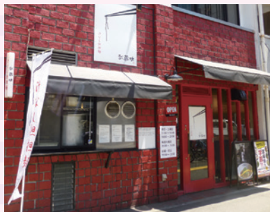
武蔵坊地藏通り店

花 あらあら(笑)。思い返せば先生が女学院に赴任された時、「今度の美術の先生、ギリシャ神話のアポロンみたい!」との噂が最初は広まった